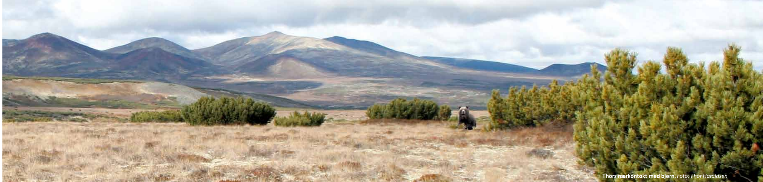
Thors nærkontakt med bjørn.

På nyåret sender TV 2 seks programmer om sykkelturen.